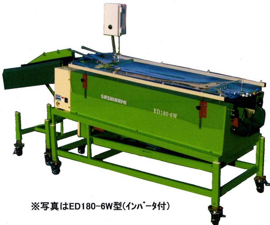
※写真はED180-6W型(インパータ付)